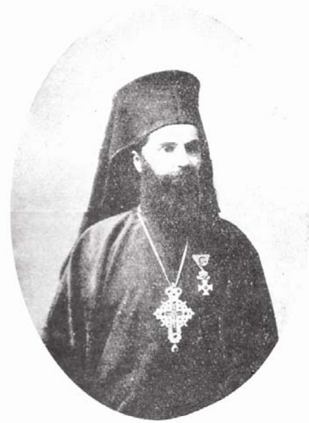
В. Фотографија на бугарскиот архимандрит Евлогиј кој беше жив фрлен во Белото Море од грчките власти