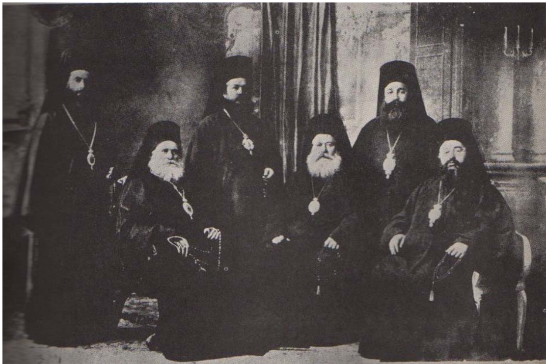
Г. Фотографија на бугарските достоинственици од Македонија избркани од нивните епархии во 1912 година од Србите