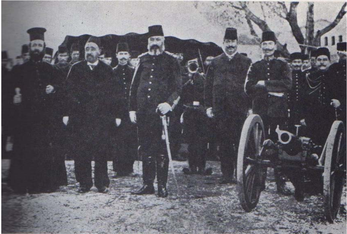
А. Фотографија на грчкиот владика Германос Каравангелис од Костур со турски цивилни и воени власти